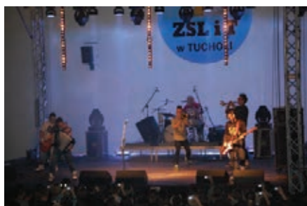
Koncert zespołu ENEJ

(malarskich, fotograficznych i innych). Na koncertach i festiwalach (m.in. koncert noworoczny, na rozpoczęcie wakacji, z okazji przejęcia przez Polskę prezydencji w Unii Europejskiej, Międzynarodowy Festiwal „Niemen 2011”), obok lokalnych wykonawców wystąpili znani artyści krajowi i zagraniczni (np. „Enej” czy „Raggafaya”). Powiat wspierał organizację innych wydarzeń ważnych