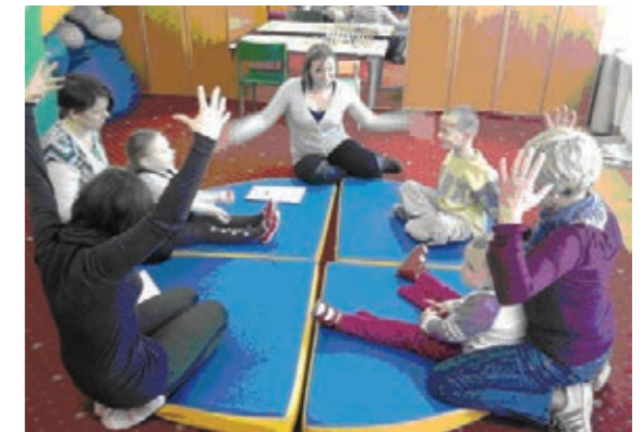
Zajęcia w Powiatowej Poradni Psychologiczno-Pedagogicznej

Powiatowa Poradnia Psychologiczno-Pedagogiczna oprócz działalności profilaktycznej i terapeutycznej w latach szkolnych 2010/2011 i 2011/2012 wykonała łącznie 3626 badań diagnostycznych oraz