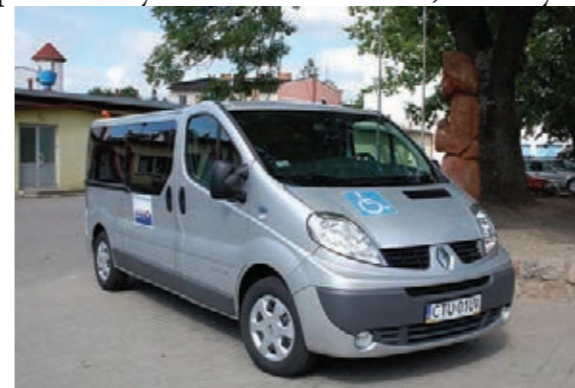
Nowy samochód dla SOSW

nansowano w całości ze środków PFRON. - dla Specjalnego Ośrodka Szkolno-Wychowawczego w Tucholi samochód 9-miejscowy Renault Trafic Grand Passenger przystosowany do przewozu osób niepełnosprawnych – koszt 115.252,00 zł (dofinansowanie PFRON 57.626,00 zł).