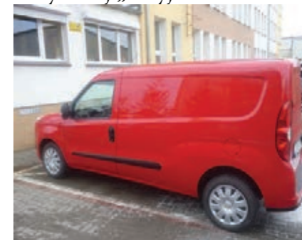
Opel Combo dla ZAZ