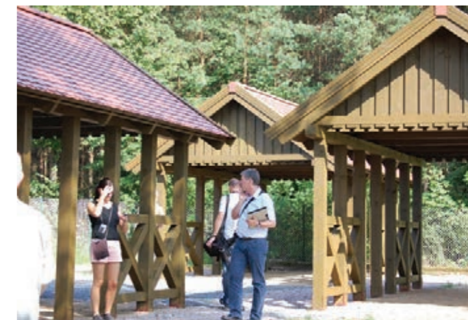
Borowiackie Szlaki - zadaszenia dla turystów