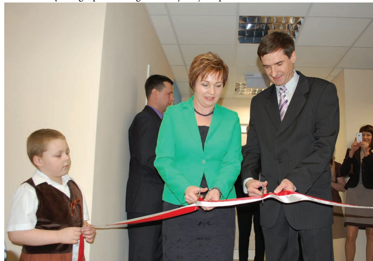
Otwarcie szpitala po przebudowie

W marcu 2012 roku zakończono główną część programu dostosowania do obowiązujących wymogów Szpitala Tucholskiego Sp. z o.o., której Powiat Tucholski jest głównym udziałowcem. W wyniku tej inwestycji powstały m.in.: oddział kardiologii z pracownią kardiologii inwazyjnej, dwie nowe sale operacyjne, poradnie specjalistyczne. Polepszo również warunki funkcjonowania oddziałów: wewnętrznego, położniczego i intensywnej terapii.