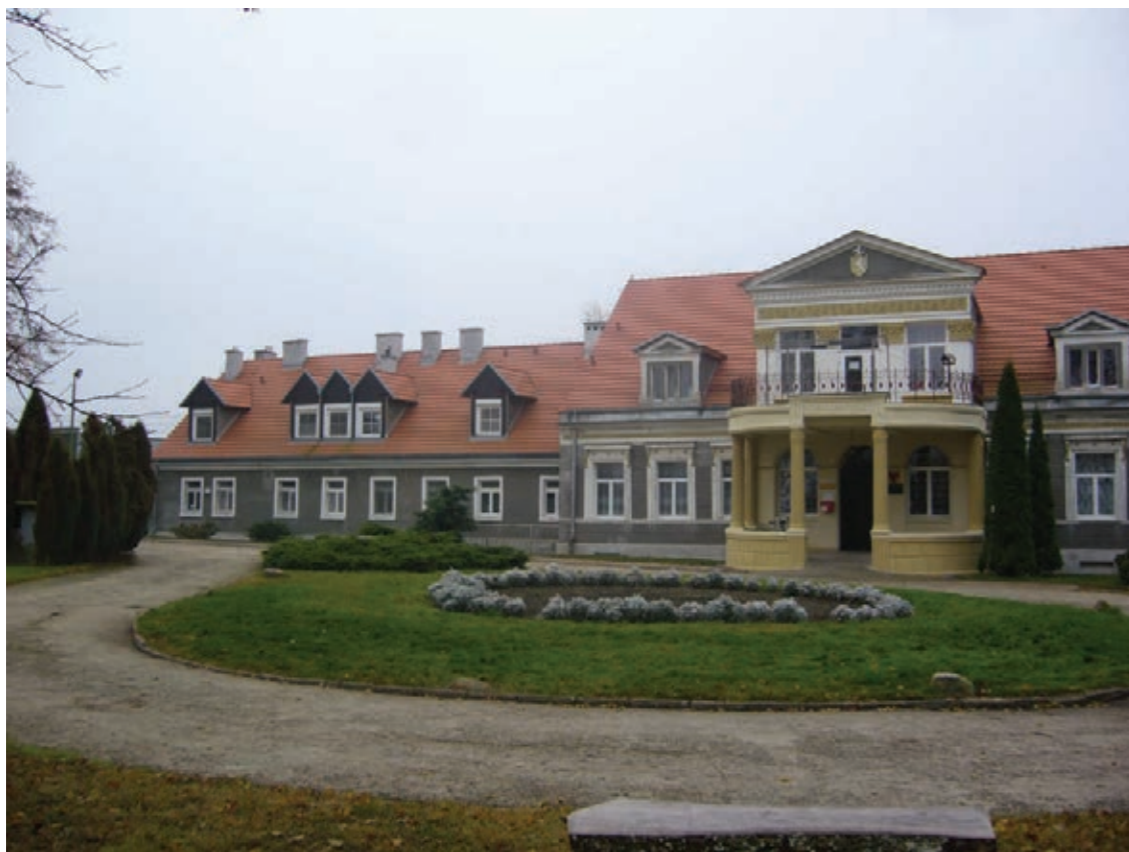
Dom Pomocy Społecznej w Wysokiej

mieszkańców DPS ważne są nie tylko warunki lokalowe, ale też pomoc wolontariuszy z klubu „Animus” działającego przy Gimnazjum nr 1, spotkania z uczestnikami ŚDS, WTZ ,