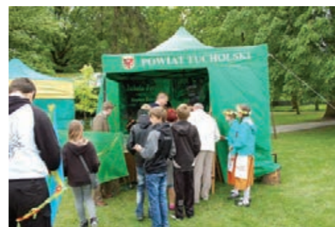
Powiatowe stoisko promocyjne