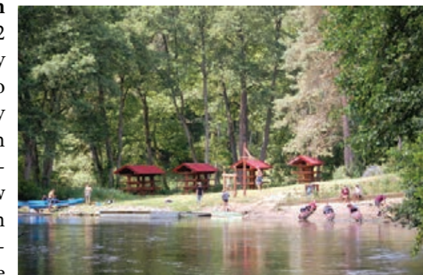
Labiryty Natury - Stanica wodna w Woziwodzie