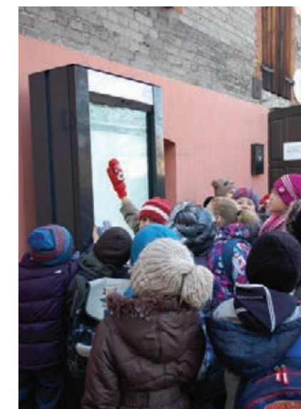
Infomat przy MBT