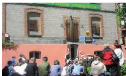
Muzeum Borów Tucholskich

W latach 2011-2012 Powiat Tucholski organizował wiele wystaw autorskich oraz tematycznych