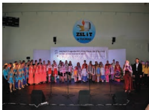
Festiwal Niemen 2011

dla mieszkańców, takich jak np. Europejskie Spotkania Strzelców Historycznych, cykl koncertów organowych, Festiwal Piosenki Religijnej, TOP Festiwal, Międzynarodowy Festiwal Muzyki Myśliwskiej i Wieżowej itp. Na szczególną uwagę zasługuje