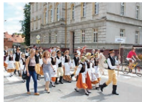
Historyczny Pochód Borowiaków